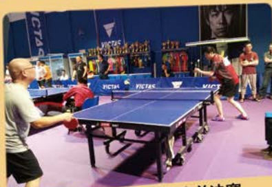
6月15日 乒乓球比赛总决赛