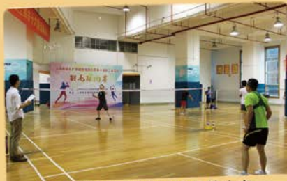
6月22日 羽毛球比赛总决赛