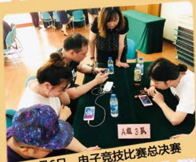
6月6日 电子竞技比赛总决赛