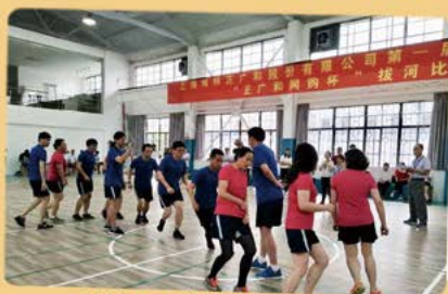
5月31日 跳绳比赛总决赛