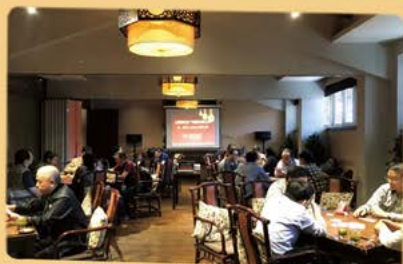
5月23日 棋牌比赛总决赛