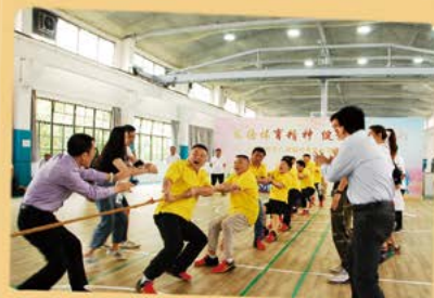
5月31日 拔河比赛半决赛